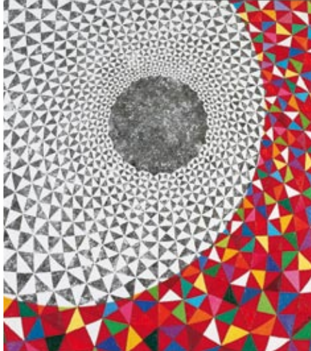
Eva Mansfeldová Nekonečno olej na plátně