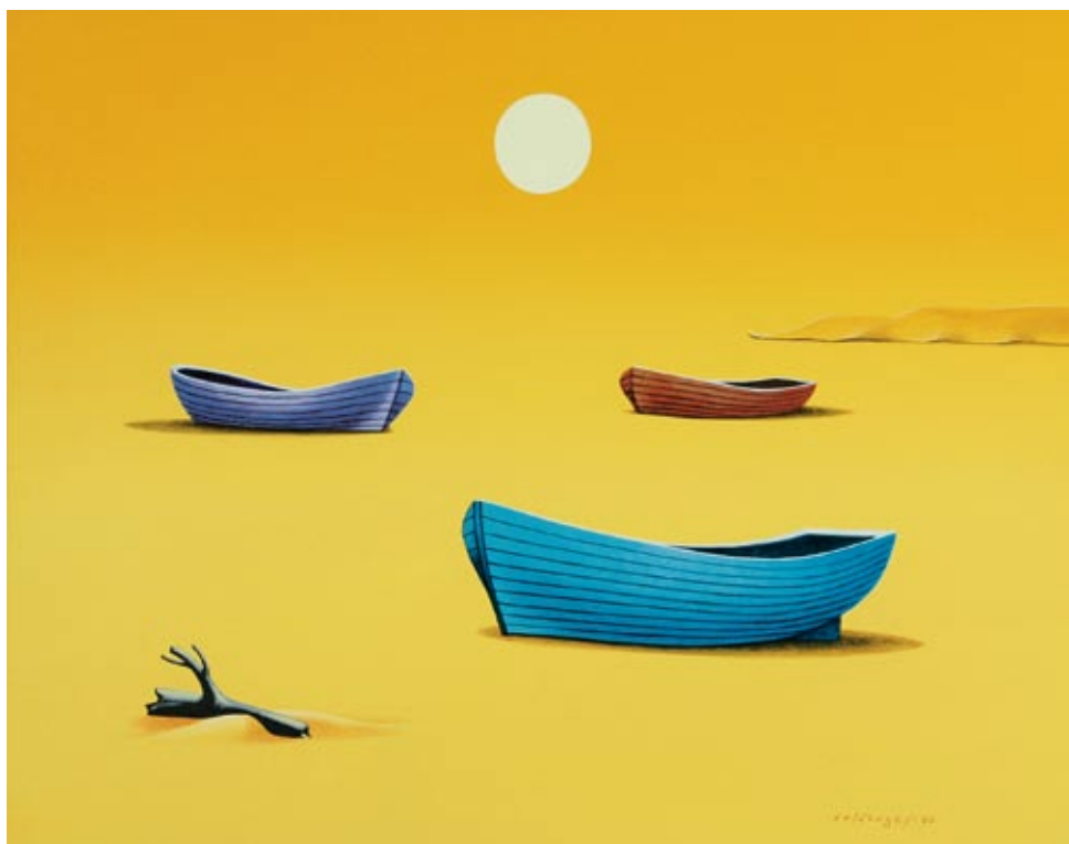
Josef Velčovský Letní odliv v Normandii akryl

Snažíme se také zapojovat do legislativního procesu tvorby nových právních předpisů s cílem ovlivnit obsah právních norem tak, aby byla naplněna premisa tzv. rozumného zákonodárce.