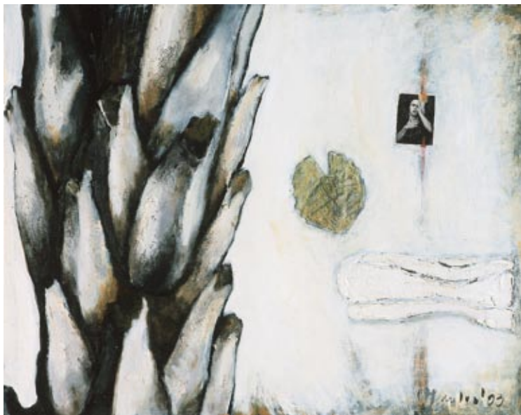
Eva Chmelová Natura viva tempera, akryl na desce

Dnešní doba je velice komplikovaná, právní regulace života fyzické osoby i podnikatele stále výraznější, rozhodovací procesy jsou podmíněny nepřehlednou řadou vstupů z různých oblastí a oborů lidské činnosti. Proto v naší praxi vnímáme jako stále potřebnější metodu kontextuálního přístupu k řešení právních problémů. Tento přístup se rovněž snažíme zakomponovat do našich služeb.